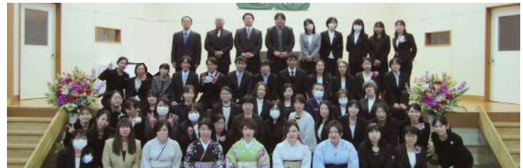
令和6年3月12日(火)2年課程通信制 第12回卒業式が行われ、めでたく卒業いたしました。 たくさんの卒業生が参加し、晴れ晴れとした表情で学び舎を後にしました。今後、看護職としての使命を立派に果たされますよう教職員一同願っております。