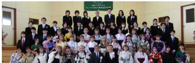
令和6年3月1日(金)3年課程 第26回生が卒業いたしました。 笑顔あふれるあたたかな式典となりました。思いやりの心、そして感謝の気持ちを忘れず、新しい環境でも活躍されることを期待しています。