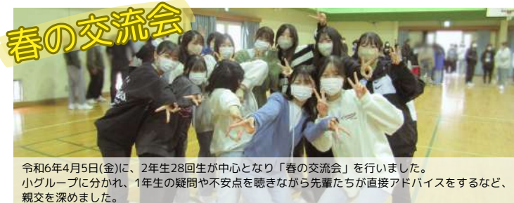
令和6年4月5日(金)に、2年生28回生が中心となり「春の交流会」を行いました。小グループに分かれ、1年生の疑問や不安点を聴きながら先輩たちが直接アドバイスをするなど、親交を深めました。

私達13回生は、深谷大里看護専門学校2年課程通信制の一員として、責任ある行動を心掛け、一生懸命勉学に励むことを誓います。(一部抜粋)