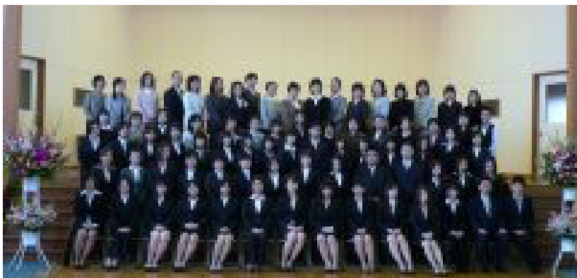
第14回生入学式 平成21年4月7日