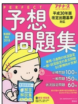
人気 No.2 「プチナース パーフェクト予想問題集」