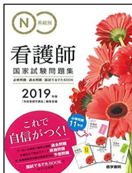
人気 No.2 「系統別看護師 国家試験問題集」