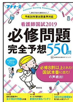
人気 No.2 「必修問題 完全予想550問」