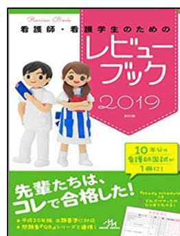
人気 No.4 「看護師・看護学生 のための レビューブック」