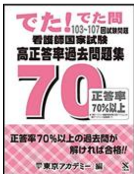
人気 No.1 「でた!でた問 看護師国家試験 高正答率過去問題集」

・国試対策本について本校の先生方にアンケート調査をした結果です。投票数の多い順に掲載しました。見本が図書室にあります。